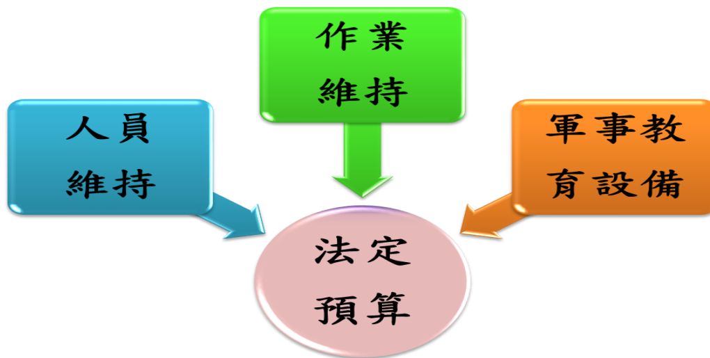
圖 4-4 預算總額分項圖