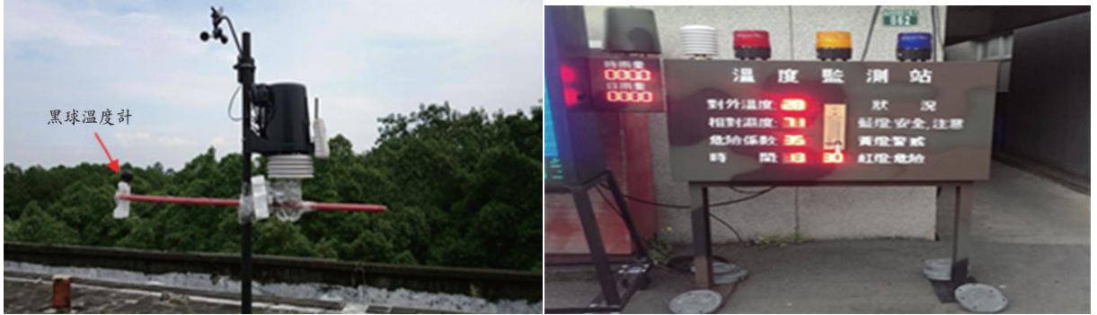
圖 4-2.1 危險係數監測儀器