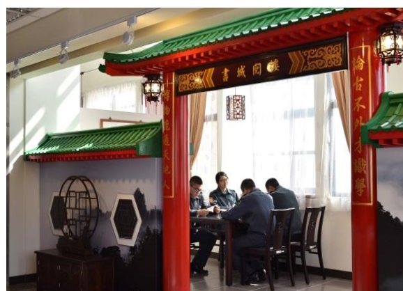
圖 4-2 圖書空間改造，閱讀氛圍營造